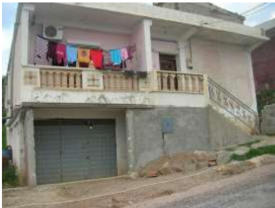
Fig N° 04 .....cellule rurale contemporaine