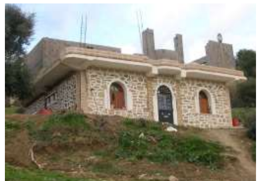
Fig N° 05 cellule rurale contemporaine