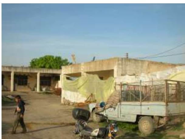
Fig N° 01 ..... Ecole primaire fermée

Exposé lors de la « décennie GIA » à des actes de barbaries, le monde rural s'était totalement dévitalisé. Ses populations l'avaient déserté pour grossir les bidonvilles des grandes agglomérations, mieux protégées des assauts des groupes armés.les terres ont été mise en jachères.