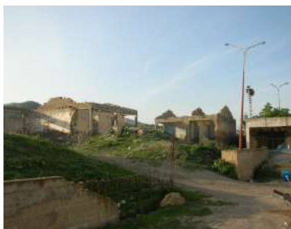
Fig N° 02 ..... logement en ruine