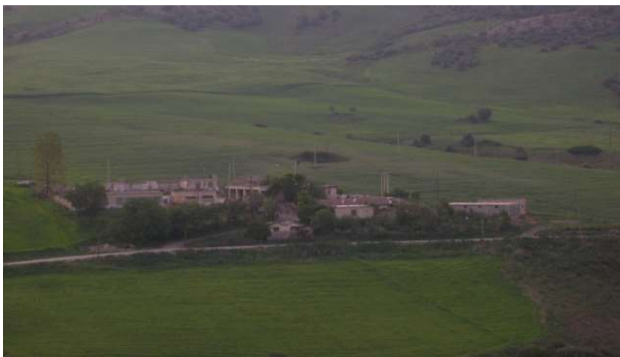
Fig N° 03 Vue générale d'une mechta abandonnée conséquences de la décennie noire.

Source auteur avril 2015(commune de Sellaoua Announa)